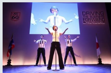
■エンターテイメント タイ歌手ミニライブ