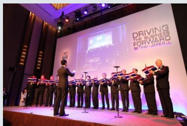
■バンコク・グリークラブより開会に先立ち、タイ王国、日本国 両国歌を斉唱