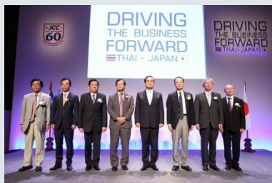
■タイ首相挨拶後記念撮影