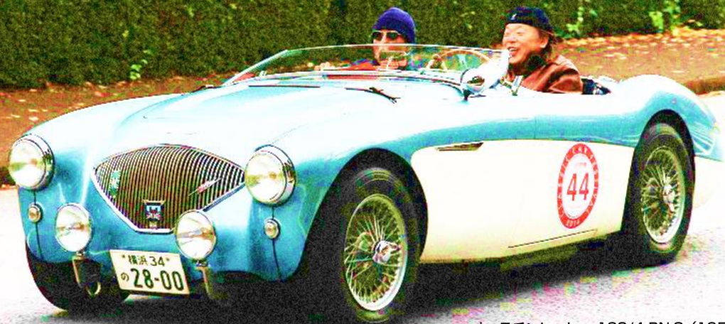
オースチンヒーレー 100/4 BN-2 (1956/英)

今年も東京・神宮外苑で トヨタ博物館 クラシックカー・フェスティバル を開催！ 東京開催8年目の今年、名称とロゴマークを一新し、春に愛知県長久手市で実施される クラシックカー・フェスティバルと統一して新たにスタート。