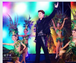
現在の伝統音楽ルクトウン

無差別に広がったファッション音楽の氾濫、お金儲けのみで知識不十分のプロデューサーやラジオDJにより、一向にオーディエンスの質が上がらないといわれる昨今のタイ音楽シーンの中で、今回のコラボレーションは新たな旋風となっているようにみえます。