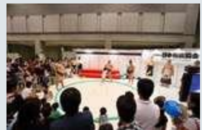
日本相撲協会は子供とのふれあい企画を実施。 思わぬ力士の登場に、訪れた親子連れからは 大歓声

さらに一般公開日の週末には親子で楽しめるキャラクターショーやヒーローショー、会場で紹介されているおもちゃで自由に遊べる「キッズパーク」が企画され、多くの親子連れでにぎわいました。