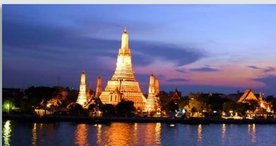
暁寺院(ワット・アルン)