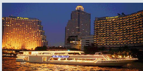
メナム川でディナークルーズ