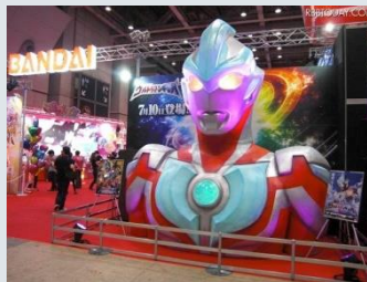
会場最大面積を誇るバンダイブース 入口で出迎えてくれるのは巨大ウルトラマン