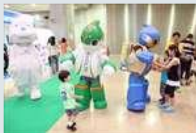
パナソニックは玩具に不可欠である各種電池を 紹介。「パナソニックの電池キャラクター 「エボルタ君」「エネルーピー」も登場