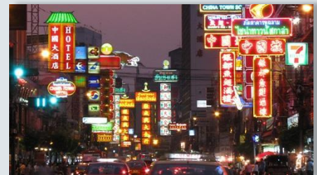
中華街・ヤオワラート