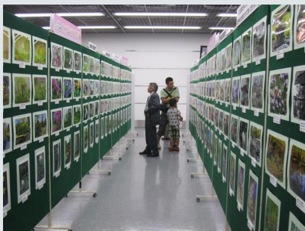
たくさんの応募作品を鑑賞する来場者