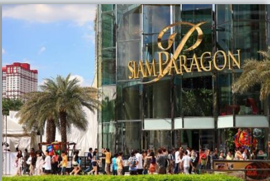
ショッピングモール・サイアムパラゴン