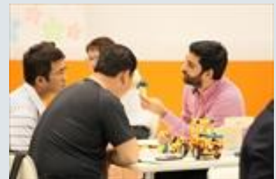
海外の方も熱心に商談中

また場内には玩具関連以外の企業や団体の出展を集めた「キッズライフゾーン」を用意。トヨタ自動車やパナソニック、森永製菓などの企業が、親子で楽しめるコンセプト商品を展示したほか、今年は日本相撲協会が初めて参加しました。