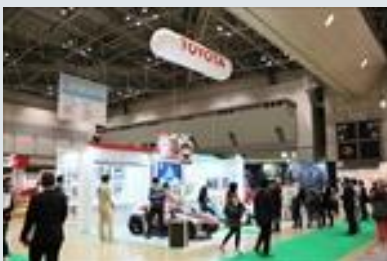
トヨタ自動車はキッズライフゾーンに 着せ替えることができるコンセプトEV 「Camatte(カマッテ)57s」を出展

また場内には玩具関連以外の企業や団体の出展を集めた「キッズライフゾーン」を用意。トヨタ自動車やパナソニック、森永製菓などの企業が、親子で楽しめるコンセプト商品を展示したほか、今年は日本相撲協会が初めて参加しました。