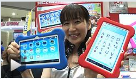
子供向けタブレットも登場

さらに子供のおもちゃを「卒業」した「JS」と呼ばれる女子小学生やJS予備軍に向けたおもちゃも、昨年に引き続き数多く登場。その他、「ミニドール」「合体・変形」「英語」「ブロック&パズル」なども注目のキーワードとなっていました。