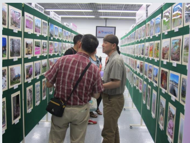
写真談義に花をさかせる受賞者