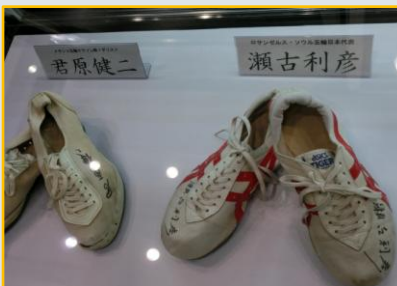
有名選手のシューズ展示