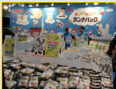
全国ご当地ランチパックでエネルギー補給