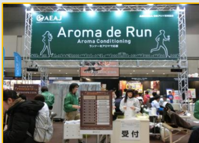
マッサージを受けられるブースもあり