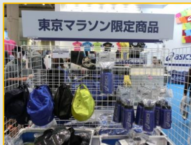
アシックスの大会限定商品