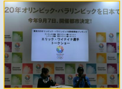
オリンピックメダリストからのアドバイスもあり