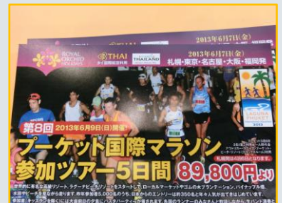
東京もいいけどプーケットもね！