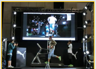
シューズ変えるとフォームが変わる？！