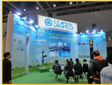
全コースのシュミレーション映像で予習も万全