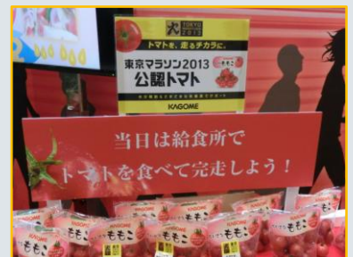
トマトのビタミンは疲労回復に効くらしい