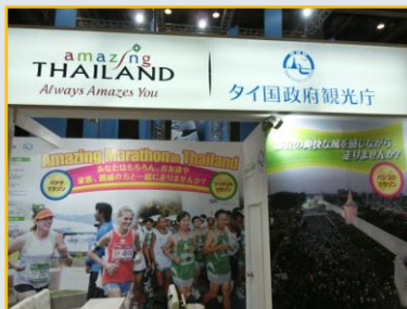
タイブース発見！国際大会があるそう