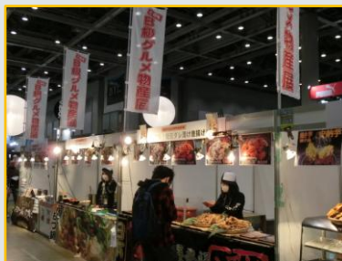
お腹が空いたらB級グルメ屋台