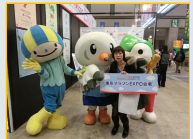
スポーツ祭東京のキャラクター「ゆりーと」と