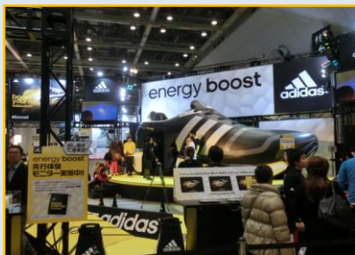
巨大な新作シューズがステージに