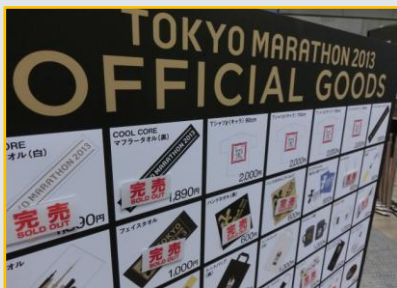
オフィシャルグッズはタオルが人気