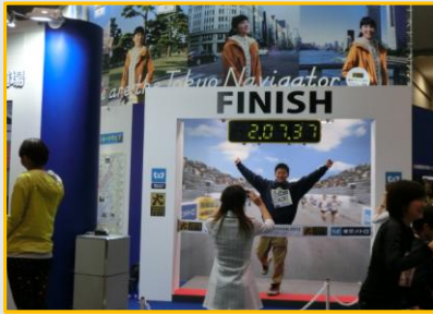
完走はイメージトレーニングから！？

どのブースも来場者≒ランナーで賑わっており、マラソンブームによる経済効果を感じました。レースのために上京してきたと思われるスーツケースを引く人も多く、レース本番までの数日は都内のホテルや飲食店などにも影響がありそうです。