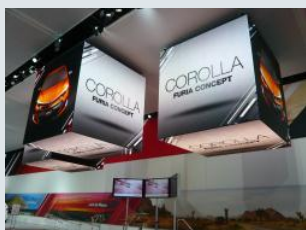
トヨタブースのキューブ型のLEDとガラスステージ。床面のガラスは細長いガラスを縦に使って側面が天板に。