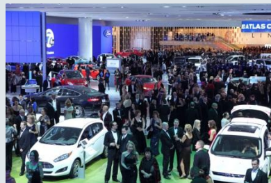
チャリティプレビューの様子

なお、76年以来、このチャリティプレビューで8700万USドル以上の寄付金が集まっているそうです。