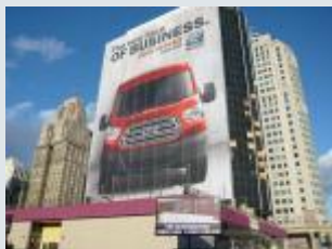
フォードの屋外広告。デカイ。