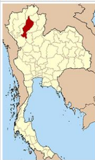
ラムパーン県 จังหวัดลำปาง

タイ象保護センターは、かつて木材の運搬など林業の労働力だった象を保護し、象に関する学術研究や、象使いの技術を継承するための施設として1991年に設立されました。木材運搬や沐浴の様子、訓練された象のお絵描きなどのショーを見学することができます。敷地内には世界唯一の象の病院があり、傷ついたり病気になった象が治療を受けています。日本映画「星になった少年」のロケ地でも知られる、象使いの生活を体験するホームステイもあり、象と人が共に生きてきたタイ独自の文化に触れられる貴重な場所となっています。