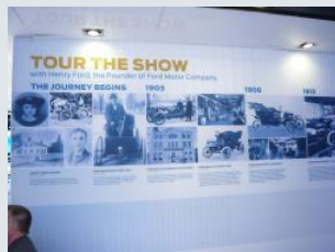
また、ブース内ではフォードの歴史をたどるツアーを開催。