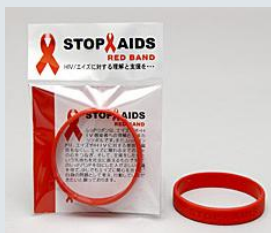
エイズ予防啓発グッズ(レッドバンド、立体レッドリボンシール)