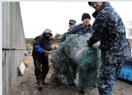
被災者とガレキの撤去を行う米軍兵士