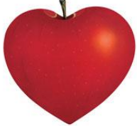
東日本大震災チャリティー・アルバム

また日本では「SONGS～」に呼応する形で、4月2日にiTunes Storeにて邦楽コンレーショナルアルバム「アイのうた」が発売されました。こちらはユニバーサルミュージックに所属する、被災地支援に積極的な参加を希望するアーティスト(DREAMS COME TRUEや福山雅治、松田聖子など)の名曲79曲が収録されています。