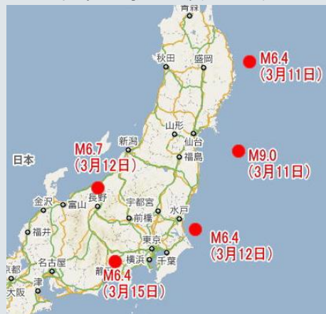
下: 他県でも強い地震が次々発生