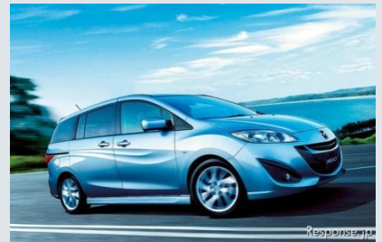
マツダ プレマシー

日本自動車販売協会連合会が発表した9月のブランド別新車登録台数(軽除く)は、シェアトップのトヨタが前年同月比6.9%減の13万0136台と前年割れとなった。シェアは42.2%だった。