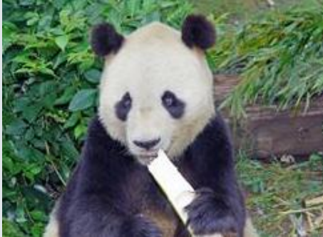
死んだジャイアントパンダのコウコウ

神戸市は2日、市立王子動物園で9月に死んだジャイアントパンダの興興(コウコウ)=雄・14歳=は、人工授精のための麻酔から回復中、嘔吐した胃液が誤って肺に入った窒息死だったことが判明したと発表した。