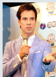
パトリック・ハーラン