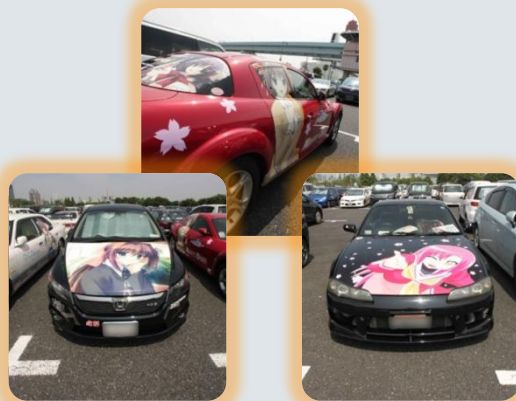
【痛車】(別名 萌車) ※【痛車】とは痛々しい車の略。