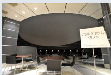
■プラネタリウム設備を取り入れたカフェ