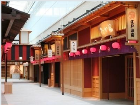
■4階・5階の江戸の街並みを再現した商業エリア